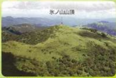
氷ノ山南側上空より

0 500 1000 1500 至 中間、大屋市場、大屋川 至 秋岡・R9 至 秋岡・R9 至 若桜・R29 至 中岡、大屋市場、大屋川 (縮尺1:25,000)